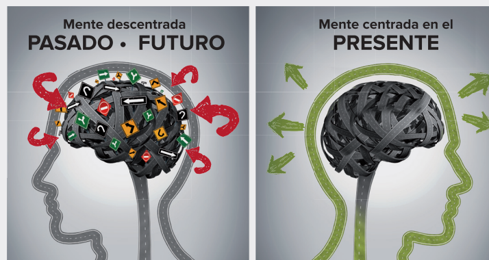
Mente plena - Mindful

A través de la implementación de la Plena Consciencia (Mindfulness) logramos fijar la atención en el aquí y ahora, haciendo a todos responsables activos de su vida personal y laboral